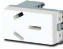
Módulo toma c/neutro 20A 20059