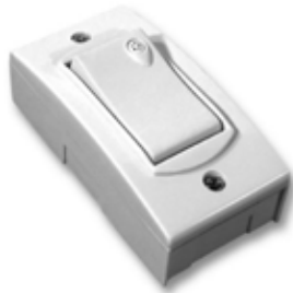
Interruptor 10A Base extra chata