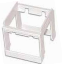
Bastidor adap p/riel din 2 módulos 20511