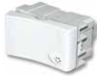
Interruptor punto unipolar 10A 40051