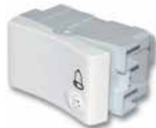
Pulsador 1 punto 10A 40052