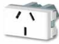
Toma corriente 10A 20067