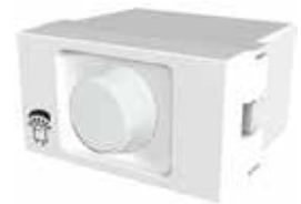
Variador de luz led dimerizable 60156