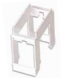
Bastidor adap p/riel din 1 módulo 20510