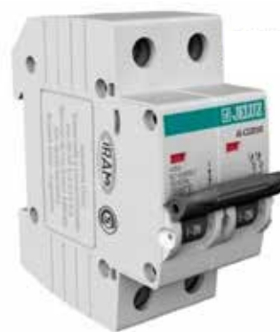
LLAVE TÉRMICA BIPOLAR

25A 2P: 225030A 40A 2P: 240030A 40A 4P: 440030A 63A 4P: 463030A