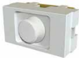
Variador ventilador de techo 60167