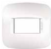
Tapa regina migñon