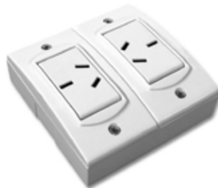
2 Tomas 10A Base extra chata