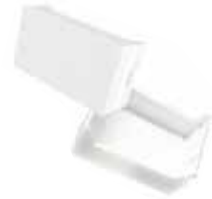
Módulo ciego 20092