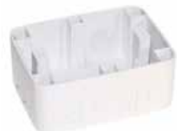
Base estanco de superficie