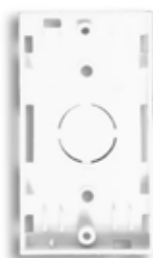
Base para 1 módulo