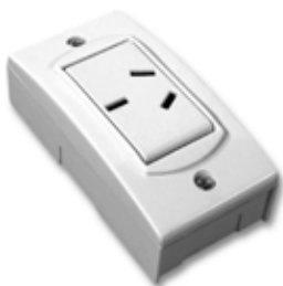
Toma 10A Base extra chata