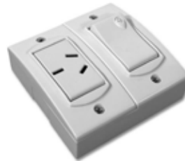
1 Int + 1 Toma Base extra chata