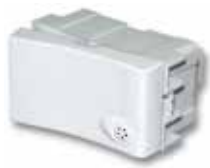
Módulo 10A combinación 40053