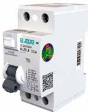
Diferenciales 30mA AC

25A 2P: 225030A 40A 2P: 240030A 40A 4P: 440030A 63A 4P: 463030A