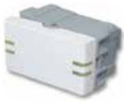
Interruptor 10A punto unipolar 20051