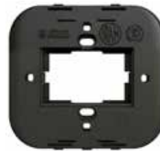
Bastidor migñon para caja 5x5