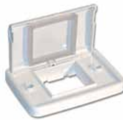
Estanco 5x10 2 módulos c/tapa