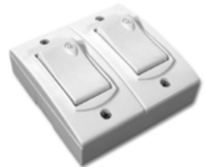
2 Puntos Base extra chata